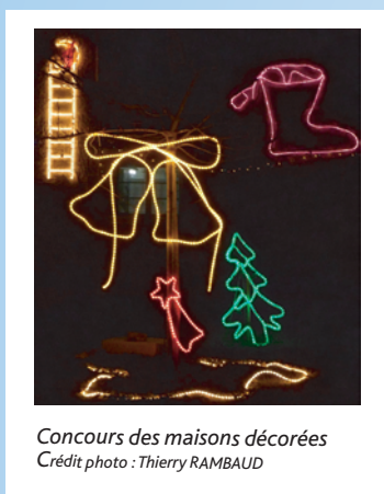
Concours des maisons décorées

A vous de jouer, et faites preuve d'imagination !